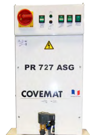
Coffret électrique centralisé